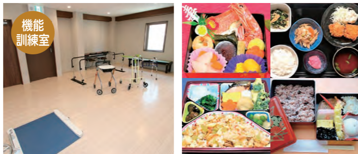
リハビリ目的の歩行練習や昇降運動などが行えます。季節に応じた豊富なメニューを提供します。