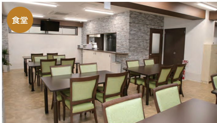
美味しい食事を快適な空間で おひとりお一人のお身体の状態に合わせて、個別対応したお食事を提供しています。