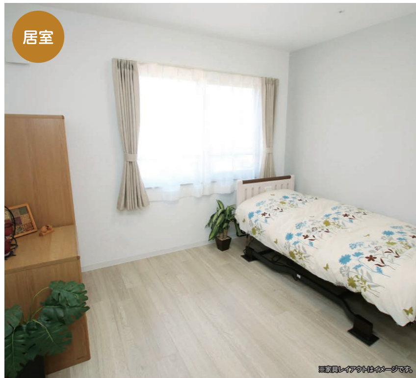
落ち着いたプライベート空間 明るい居室は自由にレイアウトして頂けます。